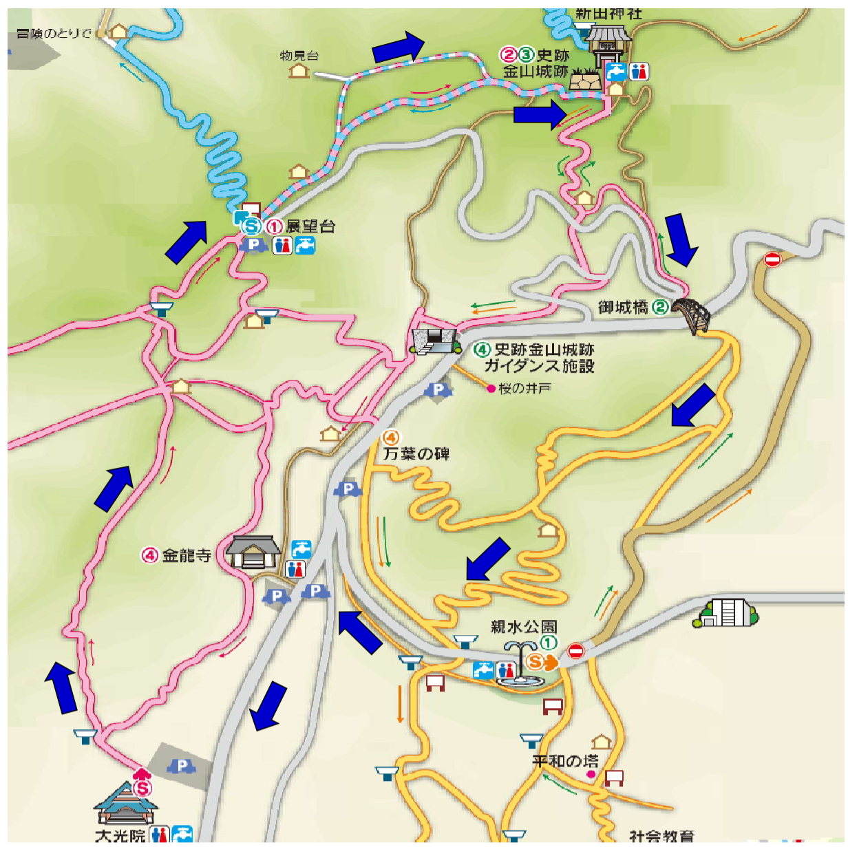
地図：太田市観光物産協会発行「金山ハイキングガイド」より