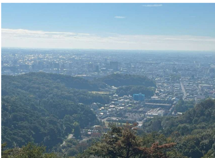
展望台からの眺望