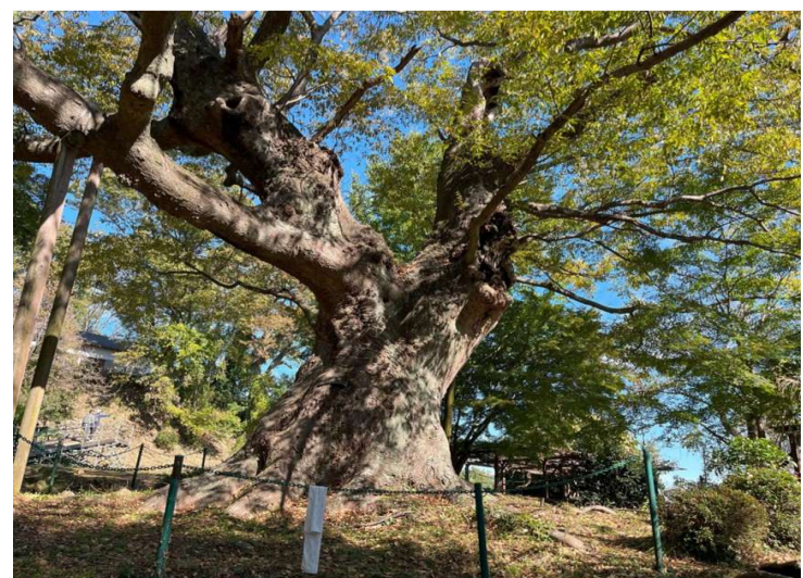
金山の大ケヤキ 推定樹齢800年 (太田市指定天然記念物)