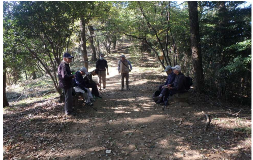
ひと休み。もうくたびれた?